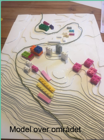
Model over området

Foreningen Bæredygtig bydel står bag planer om at etablere en bydel i udkanten af Vejle i løbet af de næste 5 - 7 år. Vi har behov for at beskrive og udvikle måleredskaber til kommende kommuneplan, lokalplan, investorer, boligselskaber og andre samarbejdspartnere. Derfor samler vi fagfolk fra hele landet til en åben debat, hvor vi deler vores viden og erfaringer om, hvad der er muligt og hensigtsmæssigt inden for selve byggeriet.